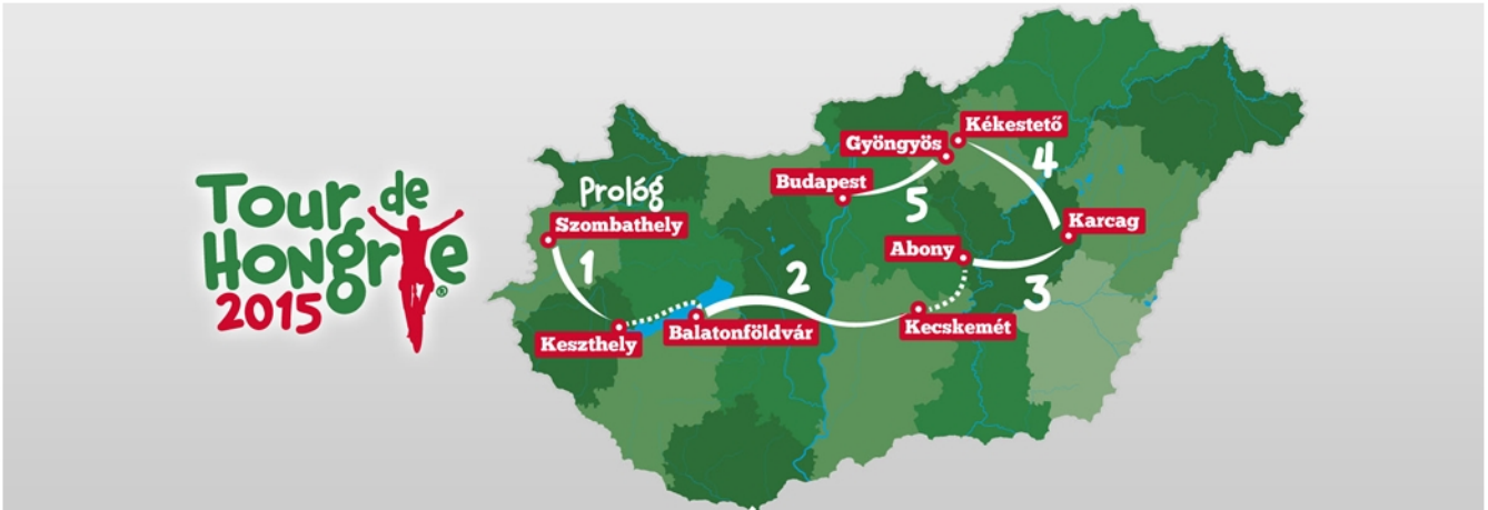
Tour de Hongrie 2015 - 5. Etap - 2015. augusztus 9. vasárnap

A Tour de Hongrie mezőnye augusztus 9-én érkezik Budapestre, ahol a Budai Vár és a Várkert Bazár előtti sétány ad majd otthont a nagy finálénak. Budapest, habár megszakításokkal, de az esetek túlnyomó részében már eddig is a Magyar Körverseny záró célállomásaként funkcionált.