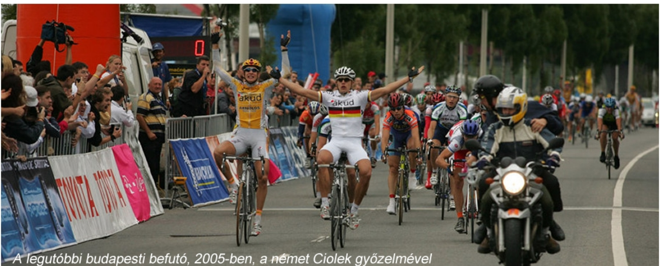
A legutóbbi budapesti befutó, 2005-ben, a német Ciolek győzelmével

1963 volt az első év, amikor Szombathelyről indult és Szombathelyre is érkezett vissza a Magyar Körverseny mezőnye, de természetesen ebben az esztendőben is érintette a fővárost a versenyt. 1964-ben is Szombathely volt a célállomás.