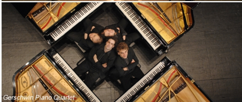
Gerschwin Piano Quartet