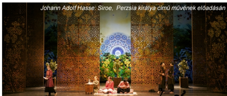
Johann Adolf Hasse: Siroe, Perzsia királya című művének előadásán